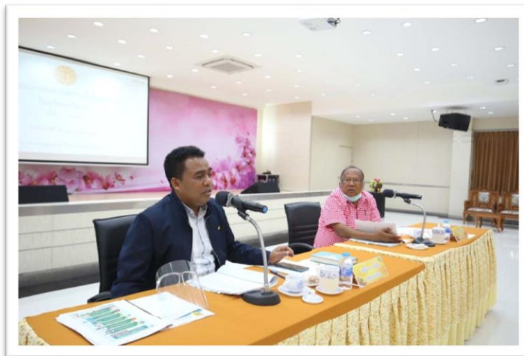
การประชุมคณะกรรมการสถานศึกษาขั้นพื้นฐาน โรงเรียนศรีอยุธยา วันอังคารที่ 26 พฤษภาคม 2563 เวลา 13.00 น. ณ ห้องประชุมคุณย่าชื่น ศรีอยุธยา 119 ปี

ดังนั้น จึงทำให้การรับนักเรียนชั้นมัธยมศึกษาปีที่ 1 และ 4 ปีการศึกษา 2563 ของโรงเรียนศรีอยุธยา เป็นไปด้วยความเรียบร้อย เป็นที่พึงพอใจของนักเรียน ผู้ปกครอง และชุมชน โดยไม่มีการร้องเรียนเกี่ยวกับการรับนักเรียนใด ๆ ทั้งสิ้น