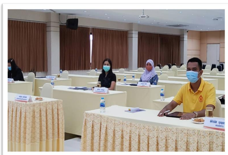
การประชุมคณะกรรมการรับนักเรียน ประจำปีการศึกษา 2563 วันอังคารที่ 9 มิถุนายน 2563 เวลา 09.00 น. ณ ห้องประชุมคุณย่าชื่น ศรียาภัย 119 ปี